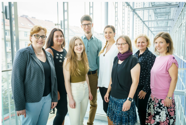
Část našeho knihovního týmu

Blog – zajímavé a užitečné informace najdete také v sekci Blogu. Upozorňujeme na vzdělávací a zajímavé akce dalších institucí, zveřejňujeme návody apod.